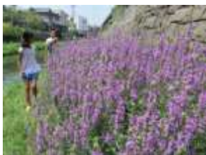
【見事なミソハギの花】