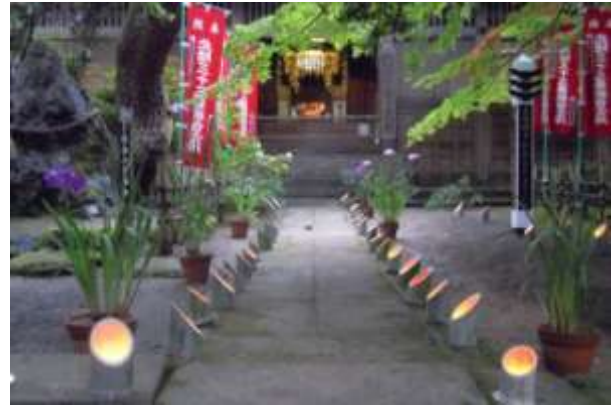
【エコキャンドルと竹灯籠】

廃油を使ったキャンドル作り、竹の切り出し、児童・生徒、地区のお年寄りによるイラストの灯籠作りなど、準備から多くの人に関わり、祭りを盛り上げている。