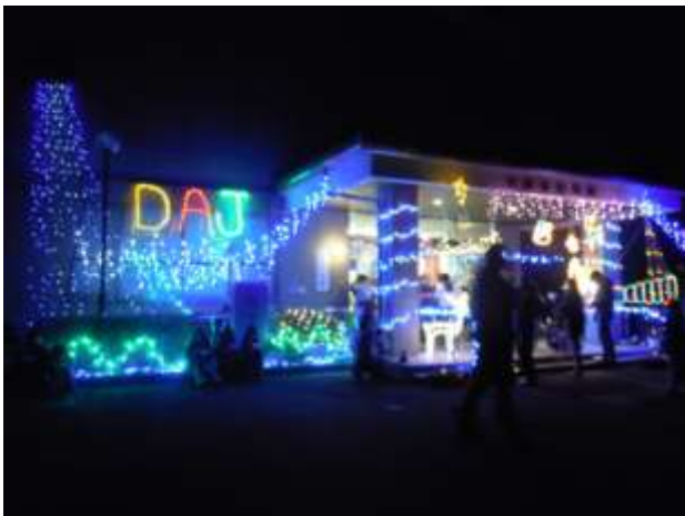
【イルミネーションでの交流会】

子どもの事業にとどまらず、このイルミネーション点灯による交流の場づくりが、公民館事業や地区事業への参加に、ひと役買っていると言える。今後も交流の場として継続しながら、地域の行事として位置付けていきたい。