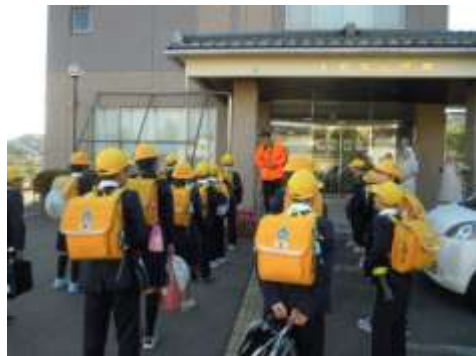
【合宿通学中の登校風景】

しかし、公民館で地区民への声かけや保護者への通知を行ってきているが、毎回のボランティアの確保に苦慮している。