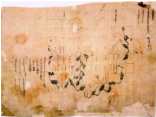
【足羽郡糞置村 開田絵図 天平神護2年（766年）】

奈良時代の東大寺荘園『糞置荘』の古図は、今も正倉院に御物として残されており、現在の地図と一致していることで知られている。