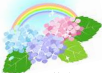
福井市の花 あじさい

監修 福井市生涯学習室 発行 平成27年10月 福井市中央公民館 〒910-0858 福井市手寄1丁目4-1 TEL 0776-20-5459 FAX 0776-20-1538 Eメール: cyuou-k@mx1.fctv.ne.jp http://www1.fctv.ne.jp/~cyuou-k