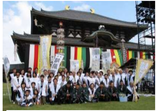
【東大寺秋の大祭参列者 光明皇后法会】

献上米はコシヒカリを昔ながらの手法にこだわり、手植え・無農薬・天日干しで収穫を行っている。お田植式、刈り取り式では、献上田にて五穀豊穡を願う神事を行い、その後地区住民と小学生、一般参加者と共に田植えや稲刈りを行う。平成27年で17年目を迎え、地区内はもとより地区外にも広く知られた事業となっている。