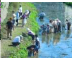
【底喰川ウォッチング】