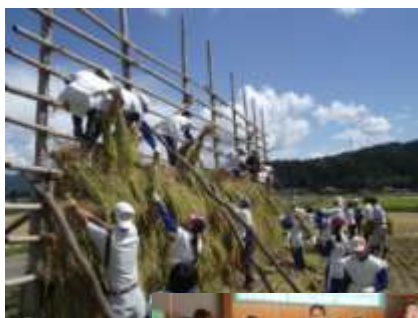
【はさばにাগり作業をする子どもたち】

地域の高齢者が先生となり、普段体験したことのないことを教える難しさ、伝えることの大切さをこの事業から学んでいる。