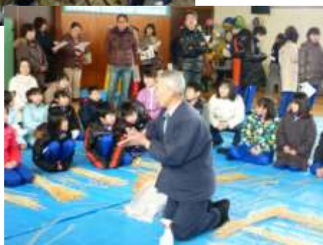
【ふるさとの達人に細縄編みを習う】