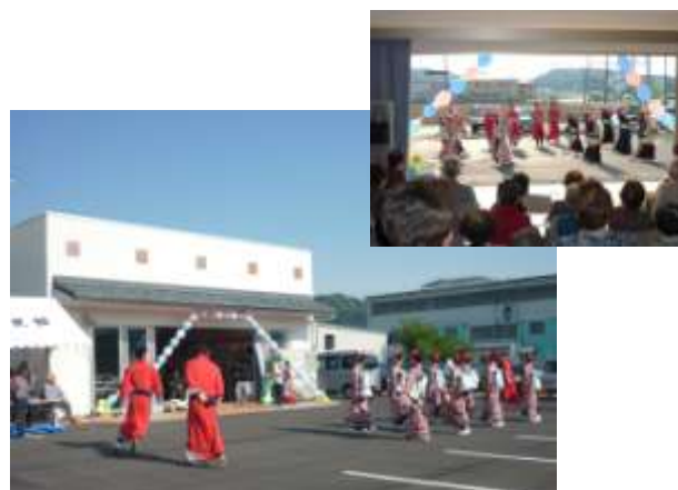
【建物を開放し、効果的に活用している】

平成26年に完成した新公民館は、外観は『お米送りの里』上文殊にふさわしく『米蔵』をイメージしつつも、現代風に造り上げている。1階のホールは、大きな窓を全て開放することで、広いホールと外のスペースを一体化して利用することができる。新しくなった公民館のお披露目をおこなったオープンフェスティバルでは、公民館を利用している自主グループや若者グループ、地元の小中学生、そして当地区にゆかりのある団体が様々な活動を披露した。