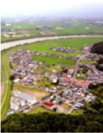
【上空から見た大安寺地区】

福井市街から北西へ6km。ゆったりと流れる九頭竜川と、萬松山の山並みに囲まれた自然豊かな地区である。