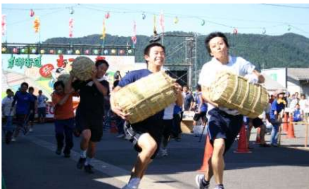
【おつくね杯俵運びリレー】