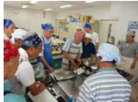
【楽しんで作る料理の味は格別！】

これらの取り組みにより、一人一人が主人公となるまちづくりに関心をもってもらい、その輪が少しずつ広がるように努めている。