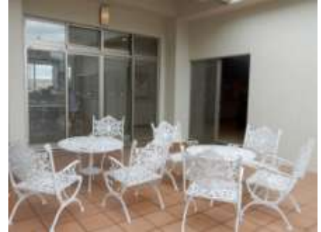
【テラスのカフェコーナー】

地域住民が気軽に立ち寄り、交流の場になるように、平成28年よりカフェコーナーを設けた。テラスにはテーブルも設置