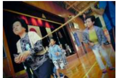
【孫とパン喰い競争】

「ふるさと運動会」の名称は、「ふるさとを懐かしく思い、帰ってきてほしい」という思いが込められている。平成27年度は第26回を数え、当地区にはなくてはならない恒例行事となっている。