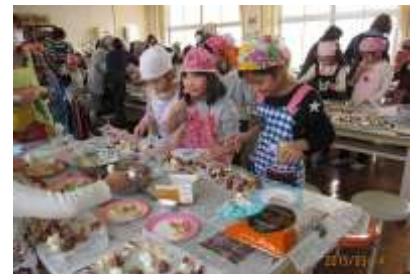
【小学生と高齢者との交流も活発】

平成13～15年度の「わがまち夢プラン事業」では、週休2日の子どもの居場所づくりに取り組んだ。