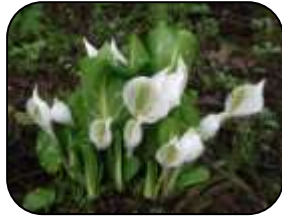
【大芝山のミズバショウ】

一光地区は福井市の西に位置し、国見岳と大芝山を源流とした一光川に沿って、上一光・下一光・五太子の三集落が点在している。四方を山に