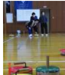
【フロアカーリング】

年間2回(5月と2月)、主にフロアカーリングに取り組んでいる。この大会は順位を競うものではなく、健康で楽しく仲間づくりをすることが目的で実施している。一回投げると歓声があがり、大変賑やかな大会となっている。回を重ねてきているので、全員がルールや競技方法を理解していて、福井市老人クラブ連合会のスポーツ大会では、昨年も含めて6回の優勝を誇り、常時3位以内を維持している。