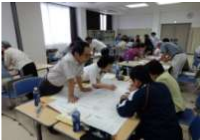
【100人以上が参加した研修会】

近年、地域のつながりの希薄化による高齢者の孤立や日常生活の不安が増加している。そこで、ひとり暮らしの不安を少しでも軽くし、安心・安全で住みよい地域づくりをめざしたいというねらいから、平成26年には「地域支え合い体制づくり」に着手した。