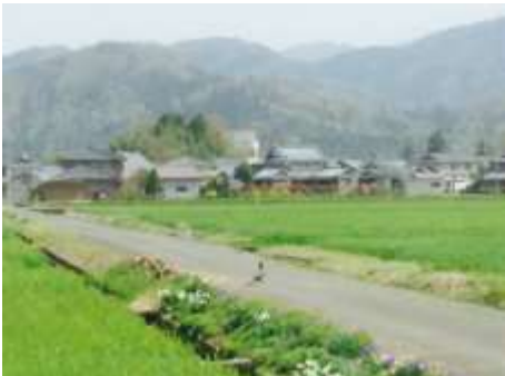
【円山地区の東部に広がる田園風景】

福井市の東部に位置し、地区の西側には国道8号線、東側には北陸自動車道が走り、東西に県道吉野・福井線（通称さくら通り）が縦断する交通の便が極めて良い地区である。