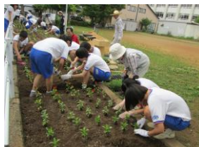
【明倫中学生と花苗植え】

地区を花いっぱいにするために、平成7年度から、自治会の方と協力して、公園や街路樹の下に花苗を植える活動を行っている。