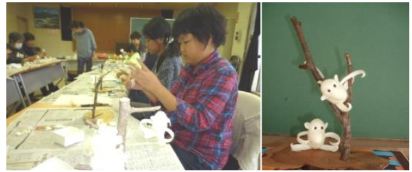
【まゆでサルのはつくり】

本郷地区には、北陸で唯一、しかも最高級品質の繭玉を出荷している「養蚕農家」がある。その繭を利用した「干支づくり」を公民館の家庭教育事業として、毎年11月に実施している。はじめは、小学生を対象に行われていたが、一般の方からの要望もあり3年前からは子どもから高齢者までが参加するようになった。地元出身の講師の指導で、作業に2時間程度要するが、参加者全員が熱中して取り組み、毎回素晴らしい作品が出来上がっている。