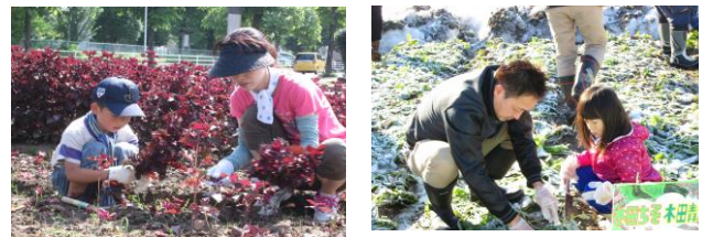
【木田ちそ、木田青かぶの収穫】

このような学び合いを通して、地域文化への理解や地区に対する誇りと愛着心を育み、木田の伝統を守り伝えていくことができると考える。