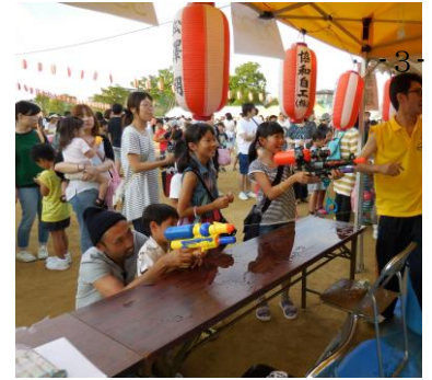
【水てっぽうでやっつける！】

これまで、若者の地域活動への参画の少なさが課題の1つであったが、平成28年度「きだやっこ」という青年グループを組織化することができた。20代～30代の青年6名が、今年度の「木田夏まつり」