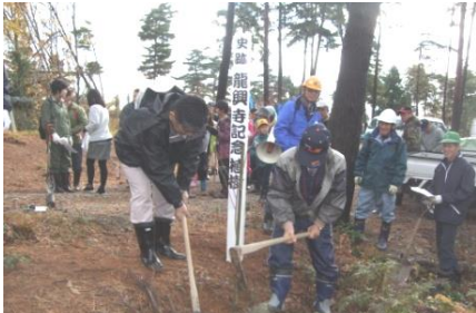
【龍興寺史跡での記念植樹】

150年間繁栄した大寺であった。曹洞宗の寺として八幡町南東に建立されて、最盛期には七堂伽藍を誇った名刹といわれた。寺跡には古井戸、礎石の数々、崩れた十数基の五輪塔、多くの石仏がその面影をとどめている。