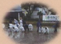
お米送り お田植え式 (上文殊地区)