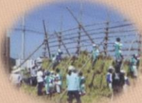
お米送り 刈り取り式 (上文殊地区)