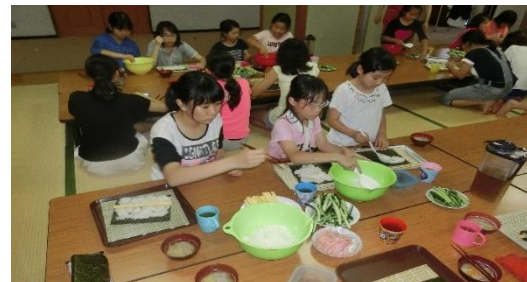
【食事作り＝太巻きずし】

＜食事＞育成会や地域の方の協力で、手作りで提供されている。1 日おきの夕食は、子どもたちが手作りしている。1 日目には餃子を、3 日目には太巻き寿司、最後はバーベキューを行う。中学生が小学生に上手に教えている姿が見られる。