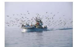
【体験実習船「こしの」】

自分で考え実践していく活動は、中学生が自ら計画し作り上げている「郷土新聞作り」や「越廼サミット」の活動にも発展してきている。