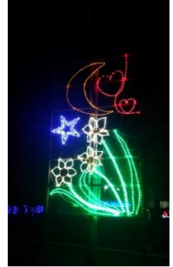
【イルミネーション】

毎年、11月に公民館西側駐車場に巨大イルミネーションを設置している。これまでは、高校生が中心に作成・設置していたが、今年は、中学生がデザインを考え、設置は青年団を中心に行われた。点灯式までに、折角できたものが壊されてしまうなどのアクシデントがあったが、無事、点灯式を迎えることができ、毎日午後5時から10時まで、点灯している。