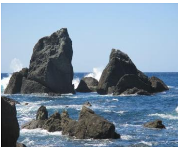
【蚊之瀬海岸の不動の岩石】

越廼地区は、福井市の南西に位置し、西方は日本海に面し、東方は急峻な山並みが続いている。東西 1.8 キロメートル、南北 8.1 キロメートルと細長い地区である。総面積は、15.31 平方キロメートルで、その 8 割が林野で占められている。