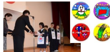
【あったかノート】 【デザインの表彰とあったかバッジ】