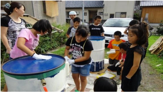
【ドラム缶風呂作り】

年2回の合宿（秋・冬）に向けて、必要な学習をするために、1年間同じメンバーで、月2〜3回程度集まり活動をしている。大人は作業に手を貸さず、見守ることを原則として事業を行っている。