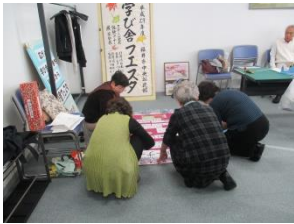
実行委員の皆さんが集まって準備中～！