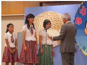
地域貢献賞表彰式