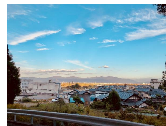
作品名：いつもの大安寺