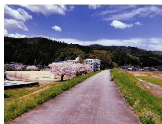
作品名：春の散歩道