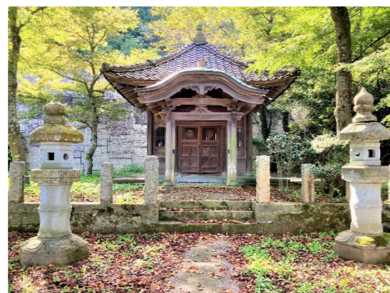
作品名：大安寺観音堂の秋