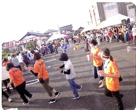
メインである「みんなで踊ろう」では、婦人会や民謡クラブを中心に民謡の輪も広がりました。