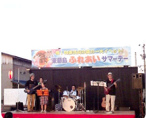
みんなのステージショーでは3組に参加いただきました。最後は子どもたちも交えて合唱して幕を閉じました。