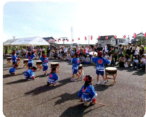
大和田保育園・東藤島こども園・さくらんぼ児童館の子どもたちは、元気いっぱいの踊りや演奏を披露してくれました。