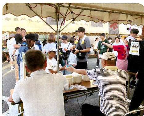
模擬店も大賑わい。どの店も昨年以上に売れていました。