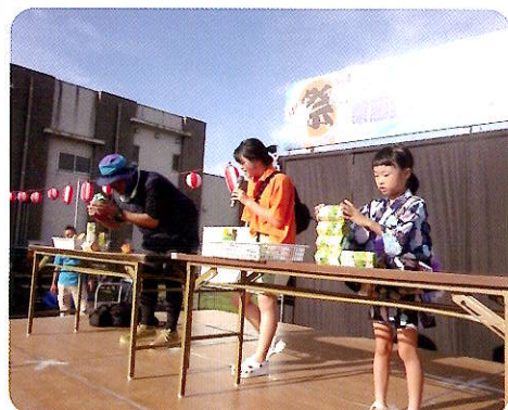
中学3年生二人の企画した「コアラのマーチ積み大会」は子どもから大人まで多くの人がチャレンジし、大変もりあがりました。