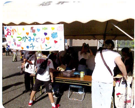
小学5年生と6年生の2グループが企画・運営した店には、多くの人が集まり、楽しんでいました。