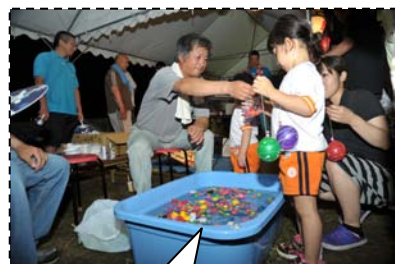
自治会模擬店では恒例のヨーヨー釣りが好評！！