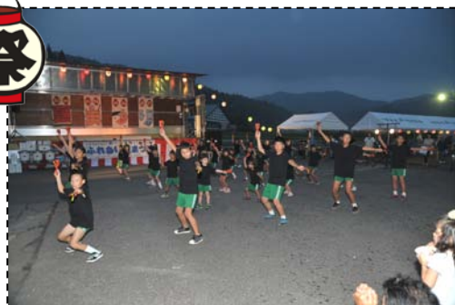
児童のふるさとの歌とよさこいでまつりが幕開けされました。