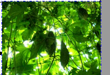
《公民館のみどりのカーテン撮影》

《発行日》 平成 25 年 8 月 10 日号 《発行所》 一乗公民館 《電話・FAX》 0776 43-2001