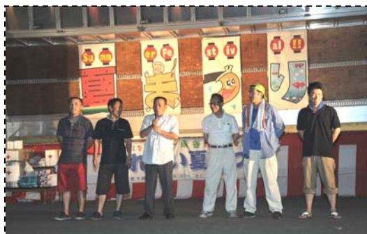
この機会に、先日開催されました県消防操法大会時の好成績の報告など発表をしていただきました。ご苦勞様でした。