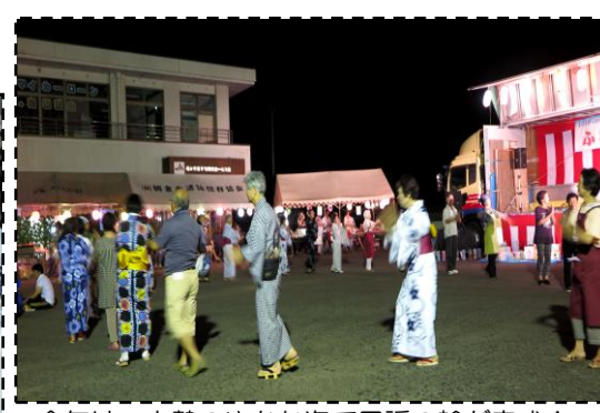
今年は、大勢のゆかた姿で民謡の輪が完成！