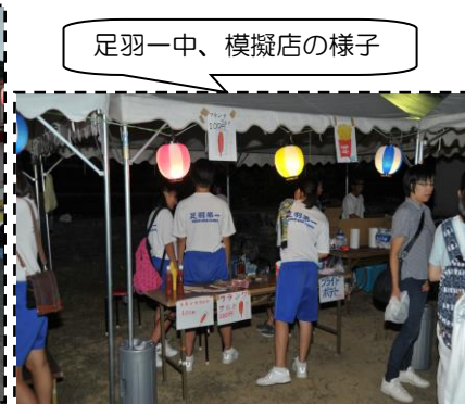
足羽一中、模擬店の様子