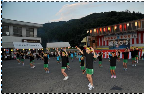
よさこいで、夏まつりがスタート！