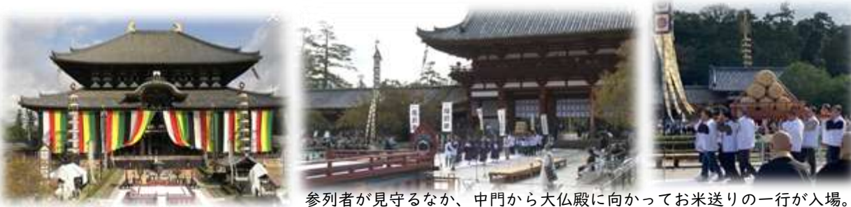
参列者が見守るなか、中門から大仏殿に向かってお米送りの一行が入場。

10月15日(日) 奈良東大寺へ今年収穫したお米を奉納してきました。今年は東大寺を開山した初代別当良弁僧正(ろうべんそうじょう)1250年御遠忌法要であり、例年になく盛大な行事でした。中門から大仏殿に至るまで、華やかな装飾が施され、行列の先陣を切って、『越前米奉納行列の入場』の声がかかると、のぼりを持った上文殊地区と社北地区の代表を先頭に『越前米』、福井県花『水仙』、福井市花『あじさい』を持った代表者が入場され、そのあとから重厚感のある米俵の神輿が続きました。なお、当日の様子はニコニコ動画でライブ配信されており、アーカイブでご視聴も可能です。機会がありましたらぜひご覧ください。