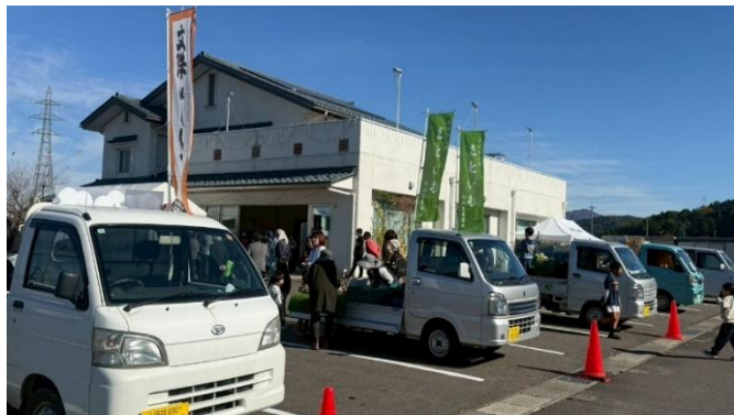
野菜などを積んだ『軽トラリング』がずらーり勢ぞろい！