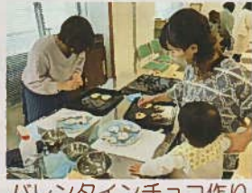
バレンタインチョコ作り