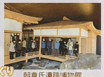
朝倉氏遺跡博物館