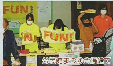
公民館まつりの会場にて