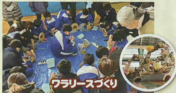
ワラリースづくり