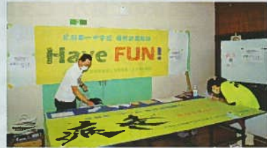
応援幕寄せ書きコーナー開設

地元一中生が公民館まつりや、イルミネーションの取り付け、点灯式にも参加してくれました。今回母校訪問駅伝の応援幕も新調され、デザインを考えるとところから参加し、地区の皆さんへお披露目することができました。