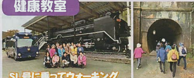
SL号に乗ってウォーキング in 敦賀市