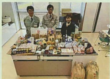
環境政策課さんへ美化推進員からお渡ししました。

上文殊地区でフードドライブを実施しました。当日は、リサイクル戦隊ワケルンジャーの皆さんの登場で大いに盛り上がりました。フードドライブにご協力いただいたみなさんありがとうございました。