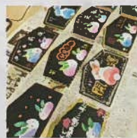
チョコレートアート絵馬づくり