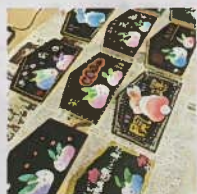
チョークアート絵馬づくり