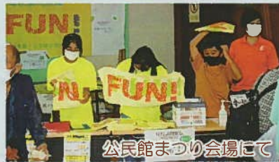
公民館まつり会場にて