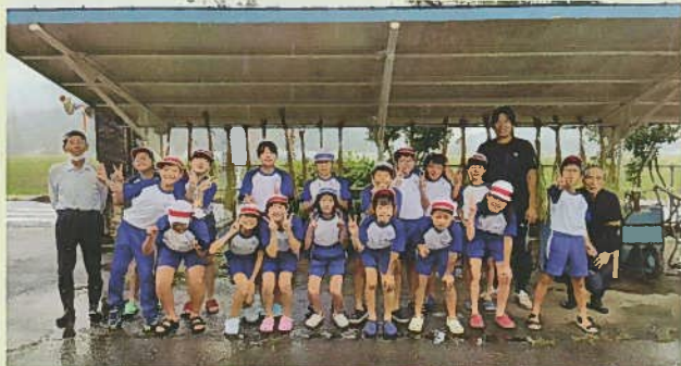
11代目稲っ子クラブさん。一人一人がとても熱心に観察に取り組んでいましたね。