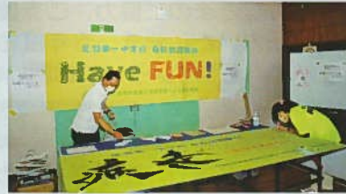
応援幕寄せ書きコーナー開設

地元一中生が公民館まつりや、イルミネーションの取り付け、点灯式にも参加してくれました。今回母校訪問駅伝の応援幕も新調され、デザインを考えるとところから参加し、地区の皆さんへお披露目することができました。