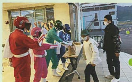
地区民から食品を受け取るワケルンジャー