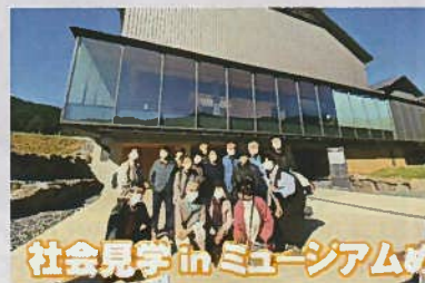
社会見学 in ミュージアムめぐり