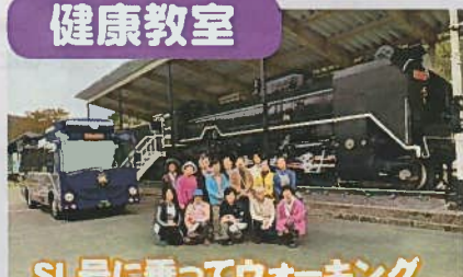
SL号に乗ってウォーキング in 敦賀市