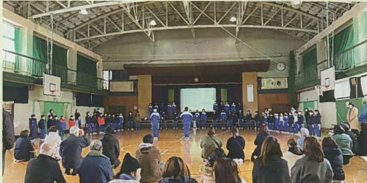
三世代交流のラストは小学生による歌のプレゼント「ふるさと上文殊」