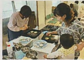
バレンタインチョコ作り