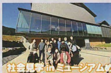
社会見学 in ミュージアムめぐり