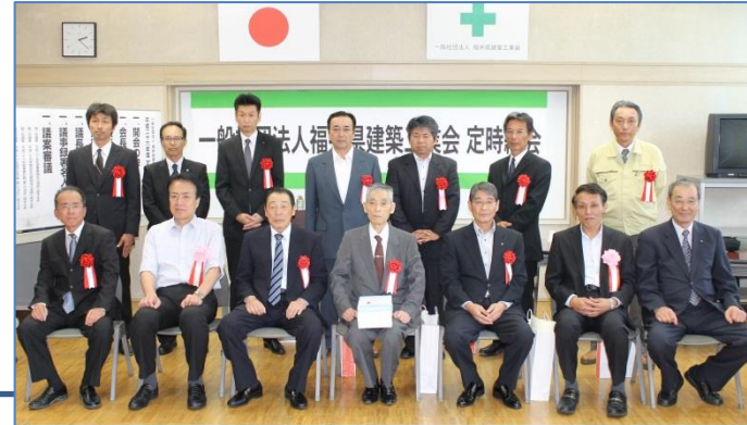
特別功労者表彰・永年勤続従業員表彰 一般社団法人福井県建築工業会 平成26年5月28日