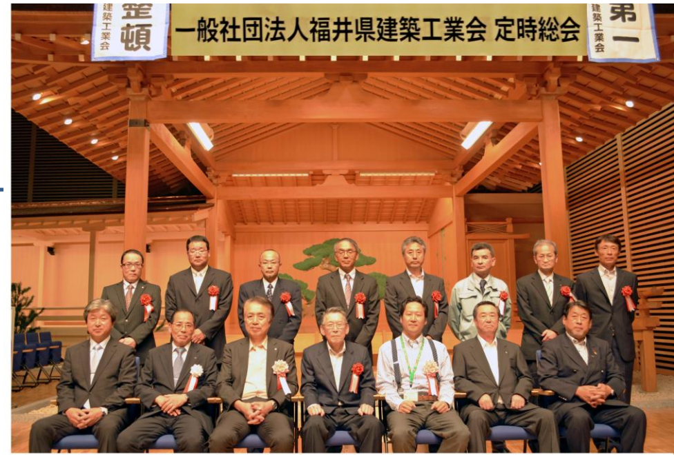
特別功労者表彰・永年勤続者表彰 平成28年5月24日