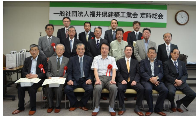
特別功労者・永年勤続者表彰式 平成25年5月30日