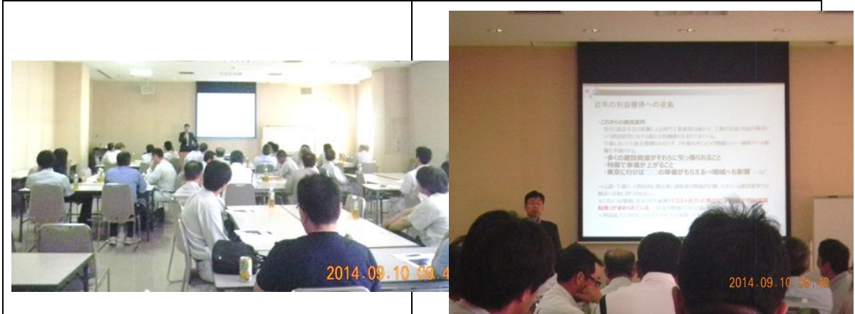
写真名：人材育成講座② 研修会全景 写真名：人材育成講座② 研修状況