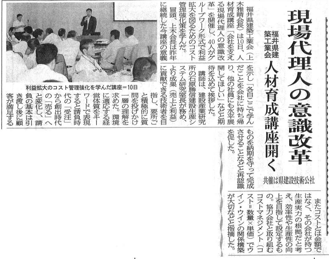
写真名：翌日の新聞記事に掲載