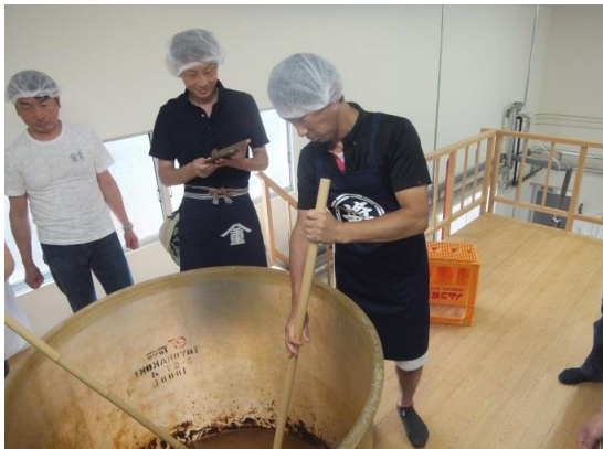
權を入れる作業体験