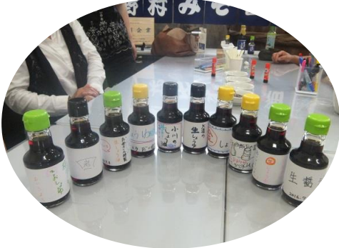
参加者全員でMy醤油を作成