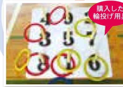
購入した輪投げ用具

既に利用しているスティックリングやペタンクに加え、うきうきサロンの集まりに利用し、皆さんの心と身体の健康に役立てたいと思っています。