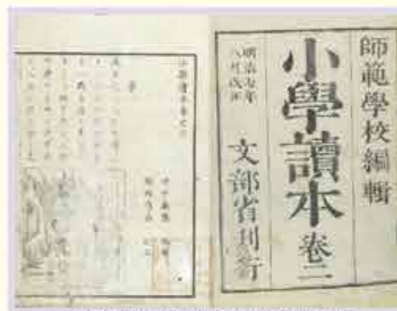
明治7年当時の小学校の教科書