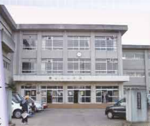
現在の社北小学校