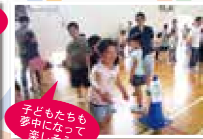
子どもたちも夢中になって楽しそう