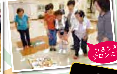
うきうきサロンにて