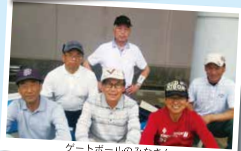
ゲートボールのみなさん