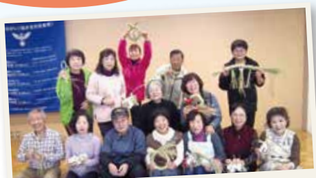
昨年度のしめ縄づくりの様子