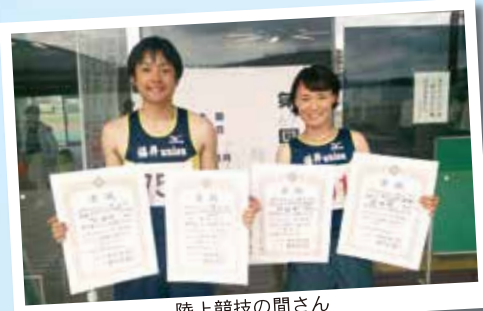
陸上競技の間さん