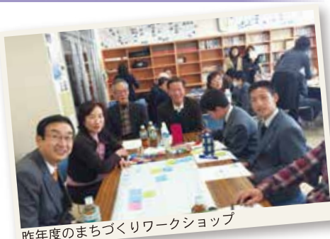
昨年度のまちづくりワークショップ